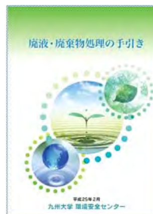
廃液・廃棄物処理の手引き

より適切な化学物質管理を行うために「化学物質管理規程」（平成24年4月施行）を制定し、部局に部局化学物質管理責任者を、研究室等に化学物質管理取扱責任者を置き、それぞれの責務を明文化しました。また、管理点検と安全教育を徹底するために、「化学物質管理規程運用マニュアル」（平成25年2月施行）を作成しました。さらに、は平成25年2月に作成し学内に配付した「廃液・廃棄物処理の手引き」の中に化学物質の管理の章を設け、「化学物質管理規程運用マニュアル」を載せるとともに、本学の化学物質管理体制とその管理の重要性を周知しました。