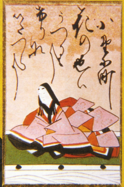
陽明文庫旧蔵 百人一首 小野小町

平安時代の屏風絵から現代の携帯メールの文字絵にいたるまで、日本人は絵と言葉の共存、同化、置換による表現を愛好してきた。それは「源氏物語」や「伊勢物語」に基づく多くの優れた美術作品を生み出すとともに、百人一首、浮世絵、文字絵遊びなどを通じて、広く一般庶民の間にも広がっている。ゴッホが日本美術に魅せられたのも、また日本のマンガが西欧の若者たちに好まれるのも、その理由のひとつは、このような日本の伝統的表現の故なのである。