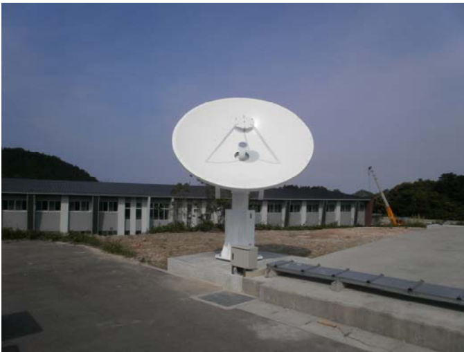
九州大学伊都キャンパスに設置されたパラボラアンテナ（直径 2.4m）

九州大学では、これらの背景をふまえて、超小型衛星に用いられているCバンド、Xバンドの地上局インフラを構築するとともに、その運用法について研究することを目的としている。