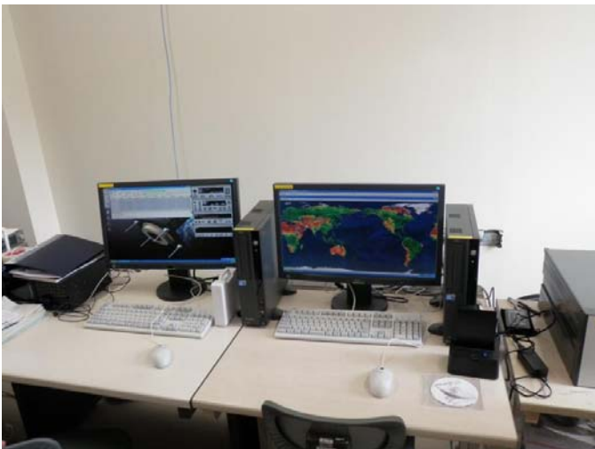
受信信号処理装置、衛星自動追尾システムウェア