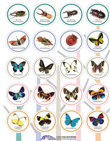
図5：子どもたちが自由に持ち帰ることができる昆虫のステッカーシート (A4)。