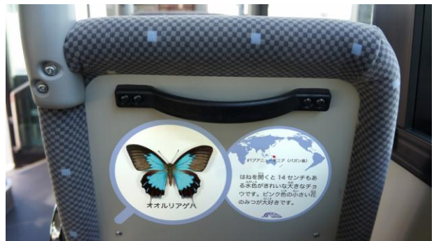
図2：座席背面に貼られた昆虫の生態等について解説するステッカー。