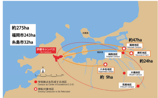
■九州大学のキャンパス計画マップ

都市の近郊という利便性を持ちながら、玄界灘に望む豊かな自然が残された静謐な環境にあります。また、ここは、古くから朝鮮半島などからの往来が盛んであったことを示す遺跡が数多く存在する歴史