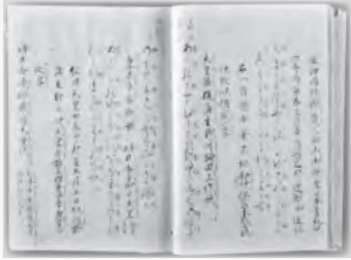
萬葉集 [玉井定時], 元禄4 [1691]