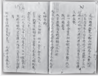
万葉集 權律師仙覺、權少僧都成俊、文永3 [1266]-文和2 [1353]