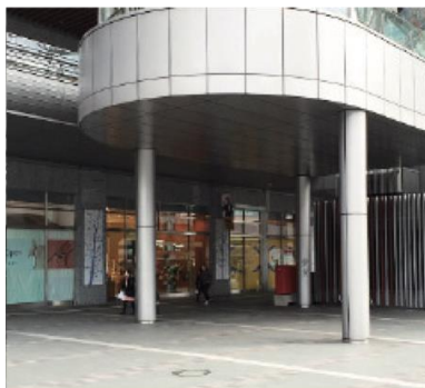
博多駅前広場（小規模イベントスペース）