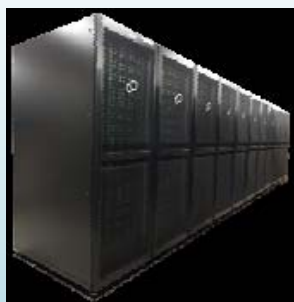
PRIMERGY CX400 S1