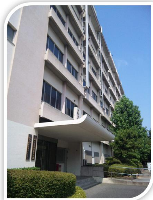
情報基盤研究開発センター 外観