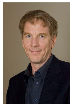
マーク・スタフォード スミス博士