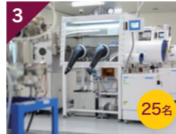
3 最先端有機光エレクトロニクス研究センター