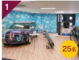
1 水素エネルギー国際研究センター

※第1便・第2便は同じ内容です。 ※各見学には定員があります。 ※当日受付にてご予約ください。 事前のお申込みは受け付けておりません。