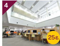
4 伊都図書館 / 教材開発センター