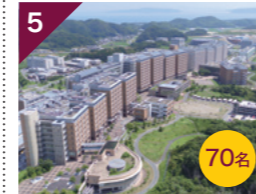
5 文系・農学系建設地など伊都キャンパス周遊ツアー (車窓ツアー)