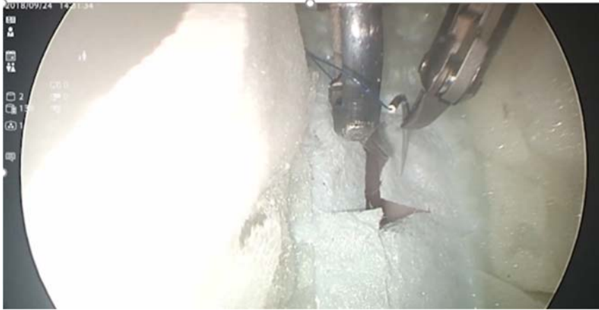
図 2. 内視鏡下で硬膜モデルに針を刺す様子 (ロボット術具は直径 3.5 mm で先端が屈曲する)