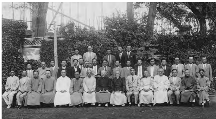
昭和9年9月23日中秋節、東方文化事業での月見の宴