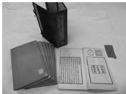
唐晏『兩漢三国学案』(九州大学附属図書館蔵)