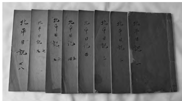
目加田誠『北平日記』全8冊(大野城心のふるさと館蔵)