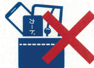
ポケット内の重ね入れ