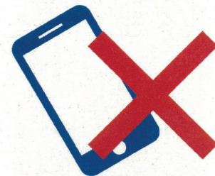
スマートフォン (磁石付カバー含む)