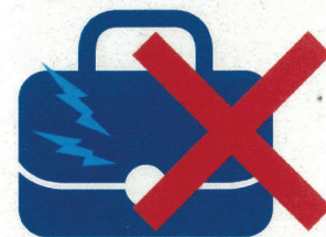
磁気仕様の留め具