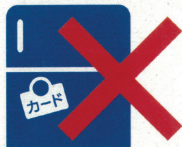
家電にマグネット付け