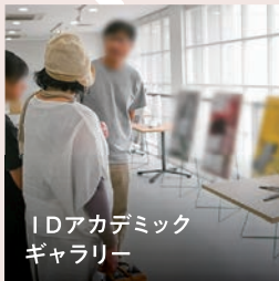
1Dアカデミック ギャラリー