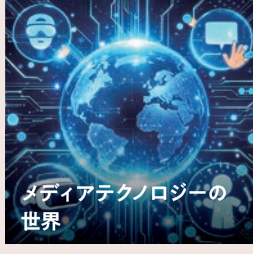
メディアテクノロジーの 世界