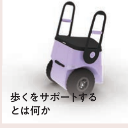
歩くをサポートする とは何か