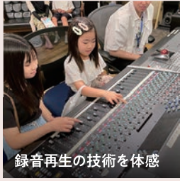
録音再生の技術を体感