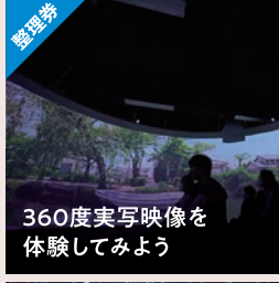
360度実写映像を 体験してみよう