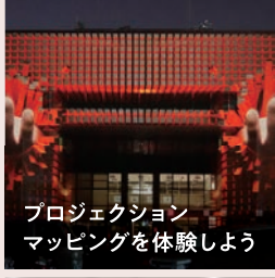
プロジェクション マッピングを体験しよう