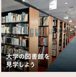
大学の図書館を 見学しよう