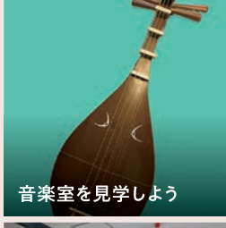
音楽室を見学しよう