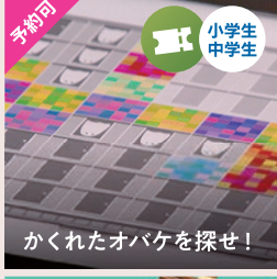
かくれたオバケを探せ!