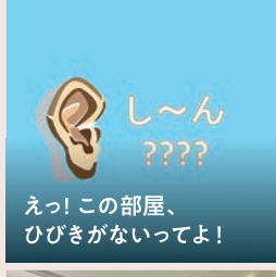
えっ! この部屋、 ひびきがないってよ!