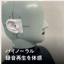
バイノーラル 録音再生を体感