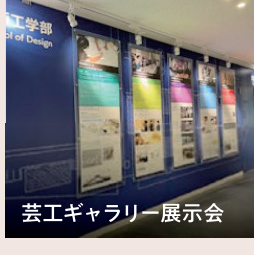
芸工ギャラリー展示会