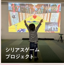
シリアスゲーム プロジェクト