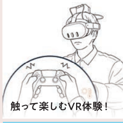
触って楽しむVR体験!