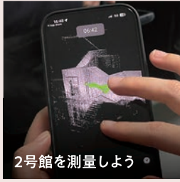
2号館を測量しよう