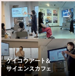
ゲイコウアート& サイエンスカフェ

見て、聴いて、作って、学んで、 九州大学大橋キャンパスで、たくさんのふしぎに触れてみよう。