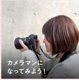
カメラマンに なってみよう!