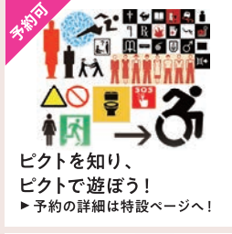
ピクトを知り、 ピクトで遊ぼう! ▶予約の詳細は特設ページへ!