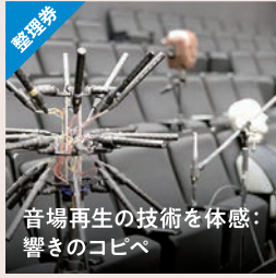
音場再生の技術を体感: 響きのコピペ