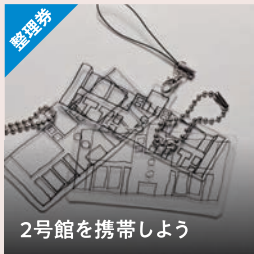
2号館を携帯しよう