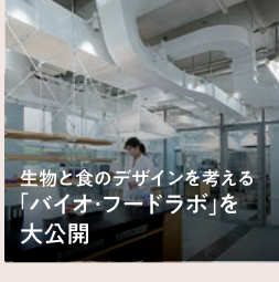
生物と食のデザインを考える 「バイオ・フードラボ」を 大公開