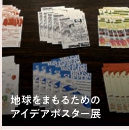
地球をまもるための アイデアポスター展