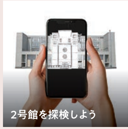
2号館を探検しよう