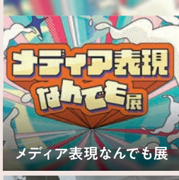
メディア表現なんでも展