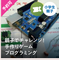
親子でチャレンジ! 手作りゲーム プログラミング