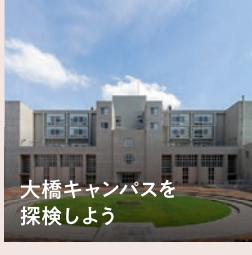
大橋キャンパスを 探検しよう