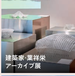
建築家・葉祥栄 アーカイブ展