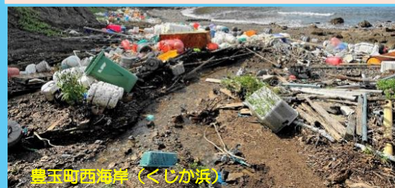
豊玉町西海岸（くじか浜）

国境の島の対馬を中心に、対馬暖流と季節風が織りなすダイナミックな自然と共生してきた暮らしの変遷を写真資料を中心に辿ります。