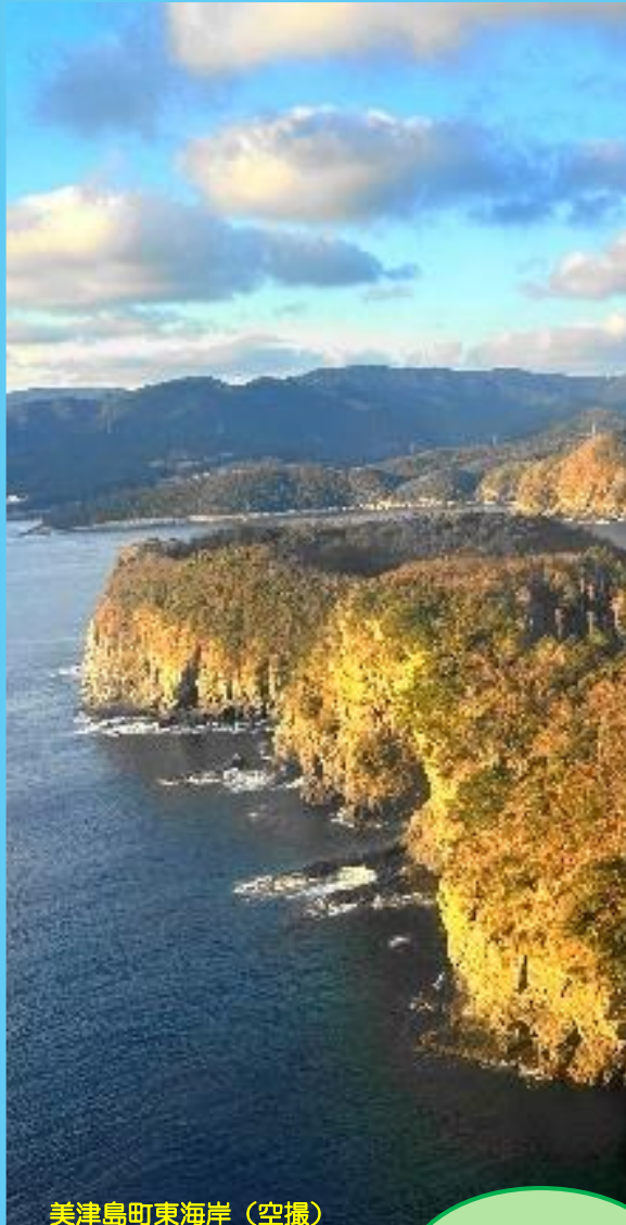
美津島町東海岸（空撮）