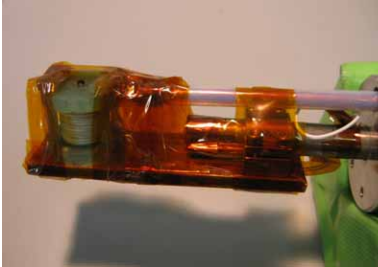
図 1 : 冷却装置の先端に取り付けた超小型パルスマグネットの写真。内径は 3mm と非常に小さい。