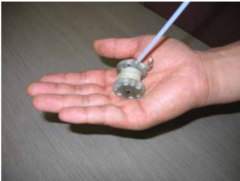
図 2 : 取り外した超小型マグネット。手のひらにのるほどコンパクトながら、地磁気の約 100 万倍の 40 テスラの強磁場を発生できる。