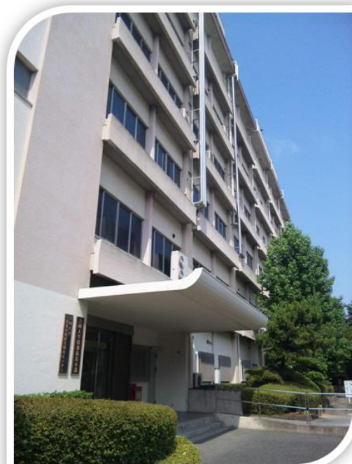
情報基盤研究開発センター 外観