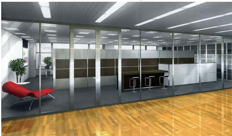
■九州大学・芸術工学東京サイト エントランス