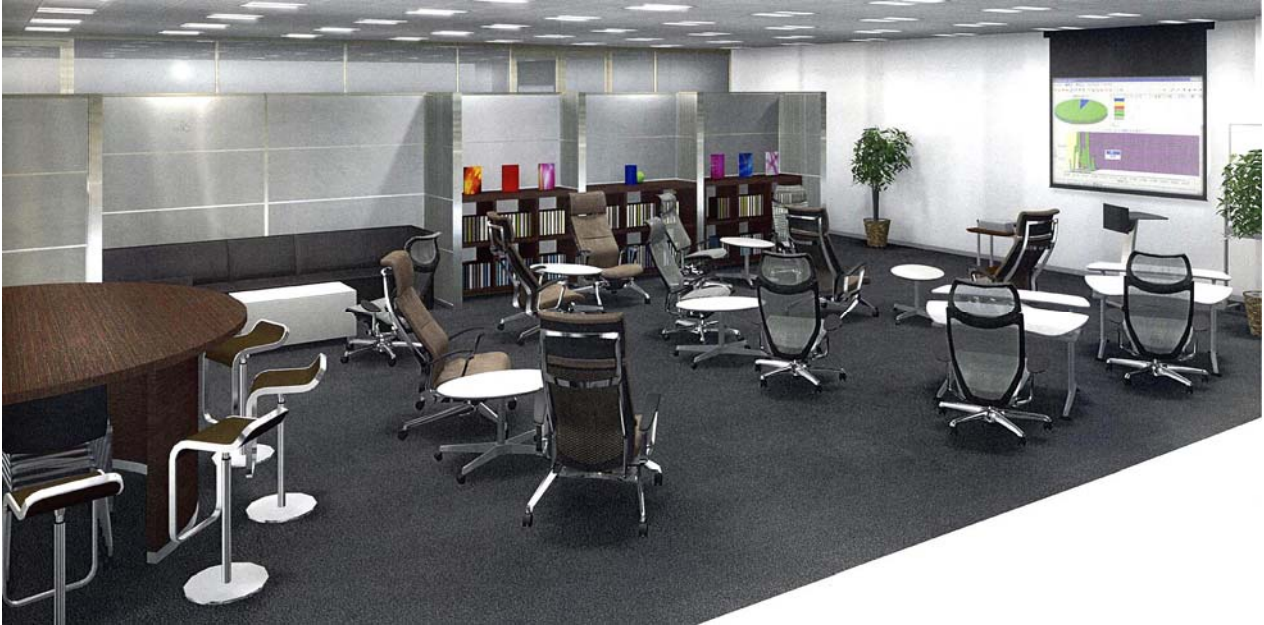
■九州大学・東京サイト セミナースペース

「九州大学・芸術工学東京サイト」（愛称:G-PARN）は、九州大学大学院芸術工学研究院が中心となって、UI (University Identity) の確立に向け、先端かつ高次のデザインをテーマに、首都圏において戦略的なプログラムに基づく広報及び交流活動を行うことを目的として東京ミッドタウン（ http://www.tokyo-midtown.com/ ）に開設するデザイン戦略拠点です。