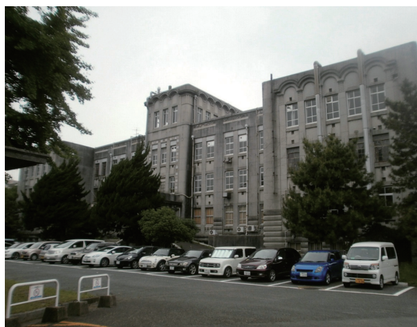
旧応力研究生産研本館（法文学部本館）

室）、工学部高温化学実験室、第三学生集会所（三畏閣）の5棟の近代建築物を巡りました。間近で見て、記憶にとどめてもらうことを目的として、普段は見ることが出来ない玄関ホールも特別に公開しました。