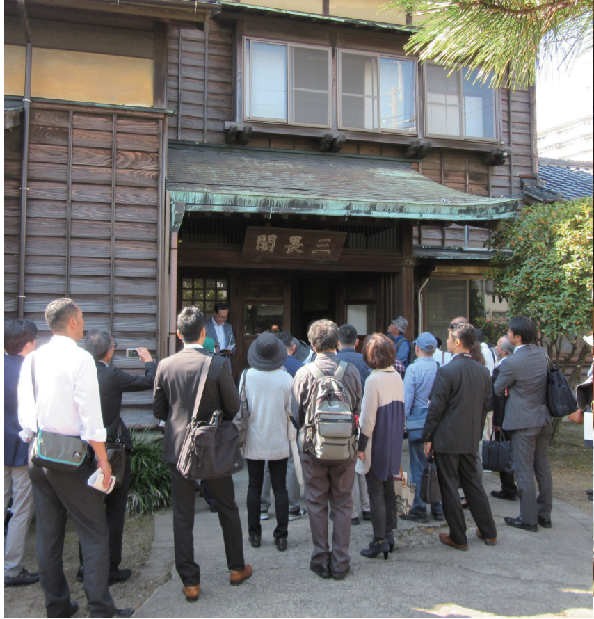
参加者で賑わう第三学生集会所（三畏閣）

成27年10月16日（金）、18日（日）、九州大学箱崎キャンパスにて、「近代建築物撮影ツアー」を開催しました。