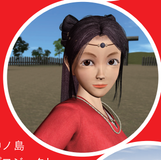
沖ノ島 プロジェクト