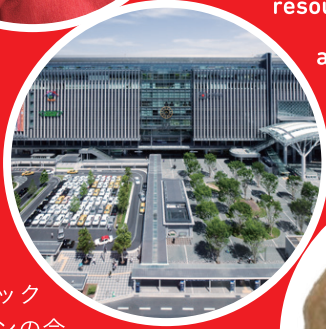
パブリック デザインの今