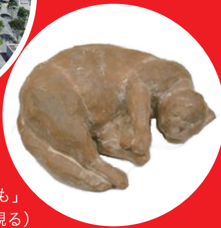
木彫「とも」 (触れて観る)