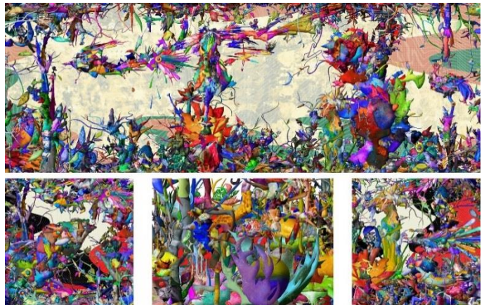
2015年静止画部門大賞受賞作品「Fertile Island」 上田タカヨシ