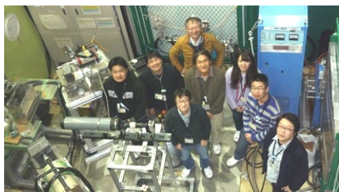
本共同実験チームのメンバー

宇宙線によるソフトウェア対策の重要性が指摘されています。本研究成果に基づいてエラー発生機構をさらに解明し、発生率の正確な評価とその対策に貢献する技術開発を進めていきます。