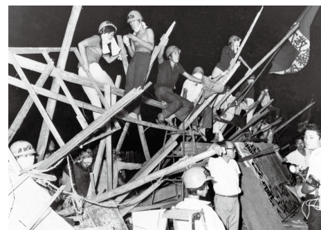
米軍機墜落現場に構築されたバリケード (昭和43年)