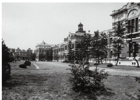
工科大学本館(大正3年竣工)