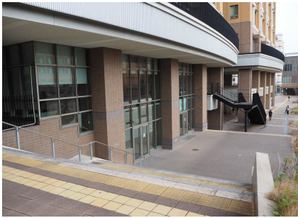
ウエスト2号館情報学習室（東）