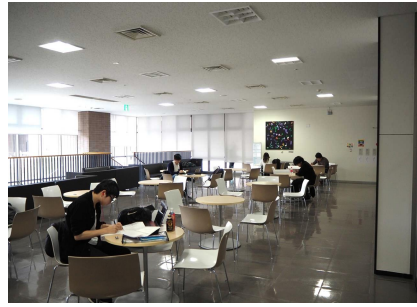
ウエスト2号館情報学習室（東）室内