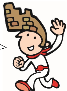
大野城市PRキャラクター「大野ジョー」

ぼくは11時・13時・15時、C-CUBEに登場するじょー！ 大野城市の郷土料理の「大野城鶏ぼっかけ」の販売もあるじょー！