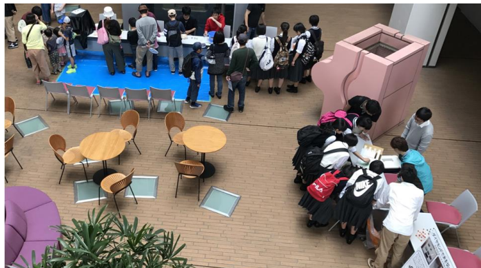
総合研究棟(C-Cube)で開催される「おもしろ科学実験」

子どもから大人まで楽しめる体験型の催し物を多数準備しています。また、これまでに聞いたことがない、知らなかったという研究についてわかりやすく学べる実演や展示もあります。大野城駅そばでアクセス抜群の筑紫キャンパスに、この機会にぜひお越しください！