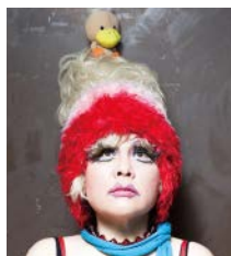
BuBu de la Madeleine ブブ・ド・ラ・マドレーヌ アーティスト

※本上映会では、公演当時作品の音楽を担当していた山中透さんによるライブサウンド・オペレーション（記録映像の音響をライブによる操作で上映）を実施します。