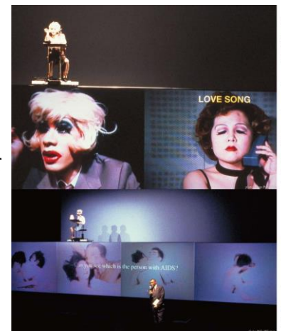
公開講座「人と人の境界を問う—ダムタイプ《S/N》上映&トーク」

2019年 11/4 (月・祝) 17:30-20:40 開演17:00 福岡市科学館6階サイエンスホール 無料(観覧料あり) 定額2000円(観覧料のみ) 定額5000円(観覧料+ドリンク)