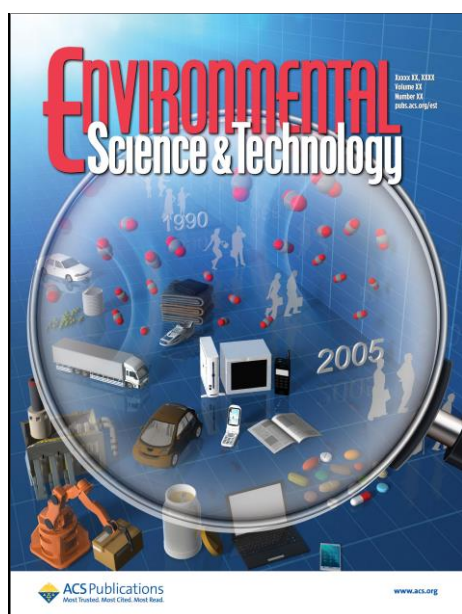
図2：Environmental Science & Technology誌におけるカバーデザイン