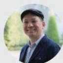
〔審査員長〕 平井 康之 九州大学大学院 芸術工学研究院 教授