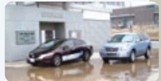
水素ステーション