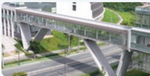
九太ゲートブリッジ