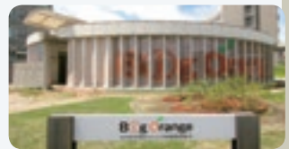
ビッグオレンジ (情報発信拠点)