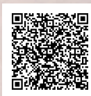
各部署学生担当窓口