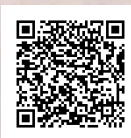
インクルージョン 支援推進室