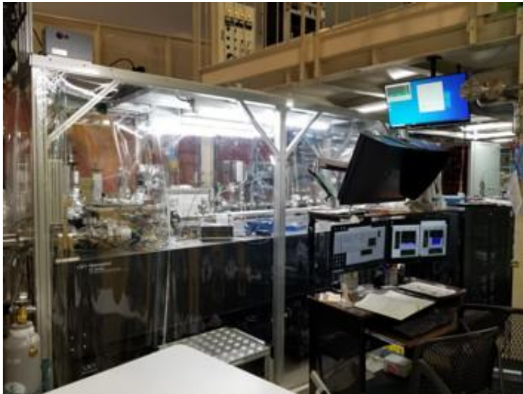
【固体有機物分析チーム】 高エネルギー加速器研究機構に設置された軟 X 線顕微鏡。固体有機物の構造や分布を明らかにする。