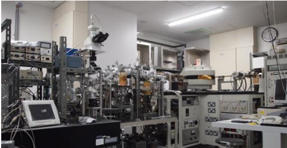
【揮発性成分分析チーム】 コンテナから採取されたガスや固体粒子中のガスに含まれる希ガスを分析する質量分析装置（九州大学）。