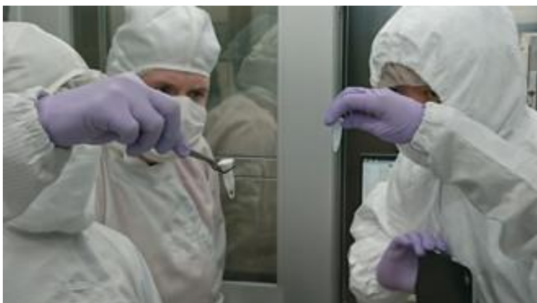
【可溶性有機物分析チーム】 九州大学地球外有機物専用クリーンルームでの分析リハーサル。