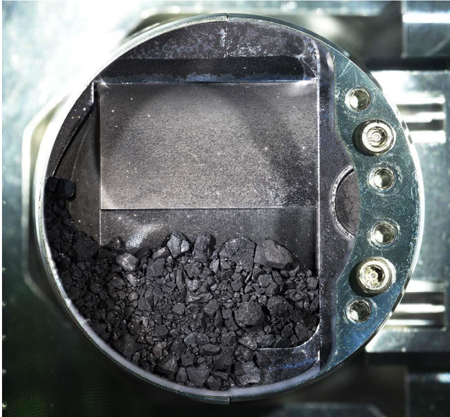
「はやぶさ2」 サンプルキャッチャ内の粒子。第一回目のタッチダウン時に採取されたものと考えられる。キャッチャ円筒の直径は48 mm。