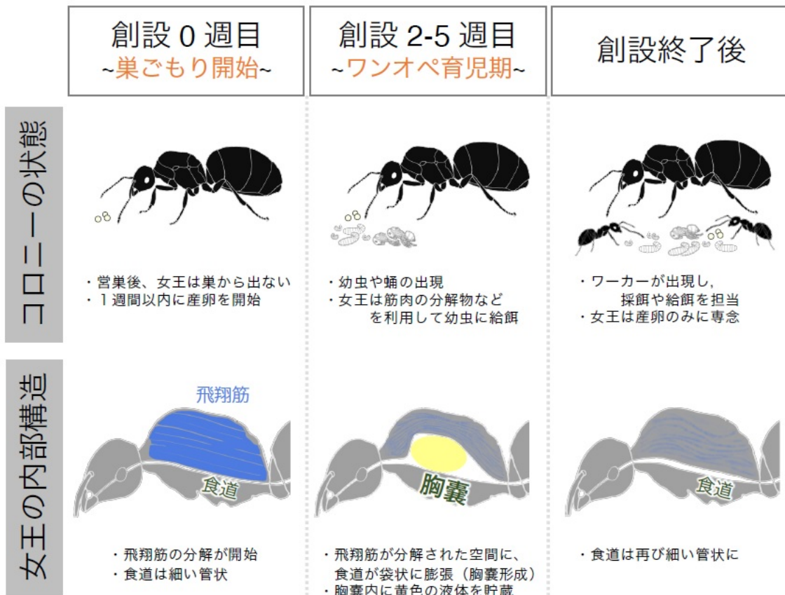
図 2. トビイロケアリの蟻居型コロニー創設と、それに伴う女王の内部構造（特に食道及び飛翔筋）の形態的变化。約 6 週間の創設期間のうち、2-5 週目は女王が単独で育児を担い、最初のワーカーを育て上げる。その過程でまず飛翔筋（青）の分解が起こり、生じた空間に食道が膨張、すなわち胸嚢が形