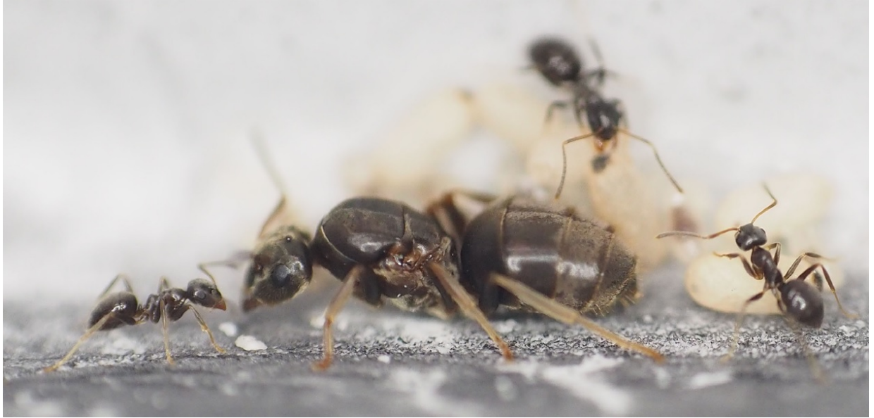
図 1. トビイロケアリのコロニー。創設を終えて間もないコロニーで、女王（中央の大きな個体）が数個体のワーカー（働きアリ）を育て上げたところ。このように最初のワーカーが育つまで、女王は巣にこもって飲まず食わずの状態、単独での育児（ワンオペ育児）を強いられる。