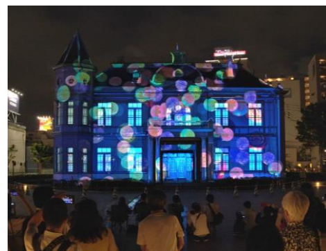
プロジェクションマッピングの展示