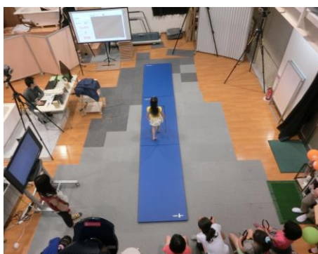
歩いてバトル！ ～「君はまっすぐ歩けるか」～

施設公開 Facebook https://www.facebook.com/1549544548639354/