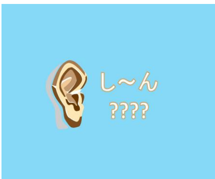
この部屋、ひびきがないってよ！ ＜無響室体験＞