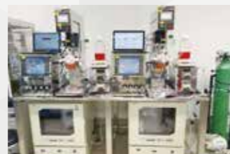
ヘリオス独自の自動化3D培養装置