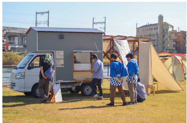
「ふくおかみなみのみんなの水辺」出店の様子

■ご相談：下記問い合わせ先からご連絡いただけましたら、ご相談をお受けいたします。