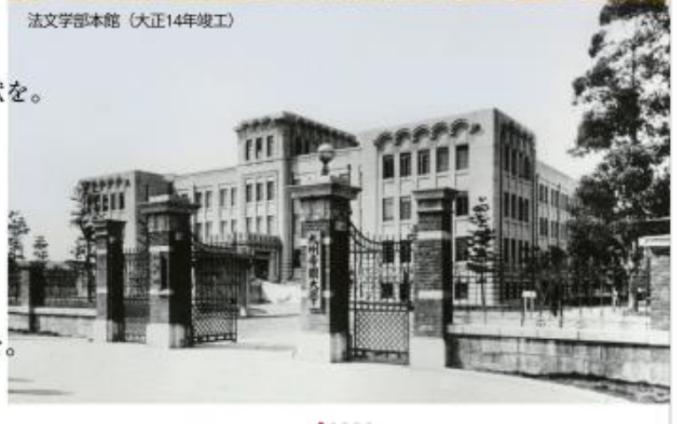
法文学部本館（大正14年竣工）