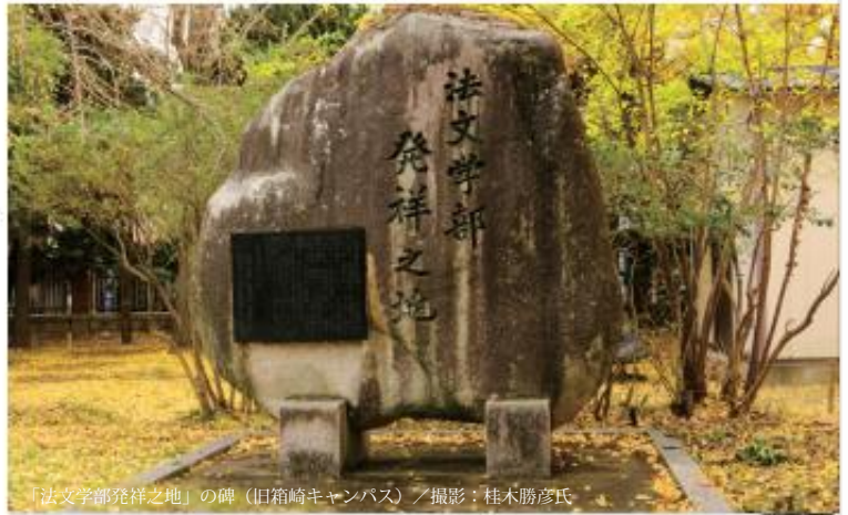
「法文学部発祥之地」の碑（旧箱崎キャンパス）

法学部／経済学部／ 文学部／教育学部の前身である、 九州大学“法文学部”は 創立100周年を迎えます。