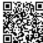
外国人留学生採用