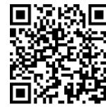
Recruitment of International Students