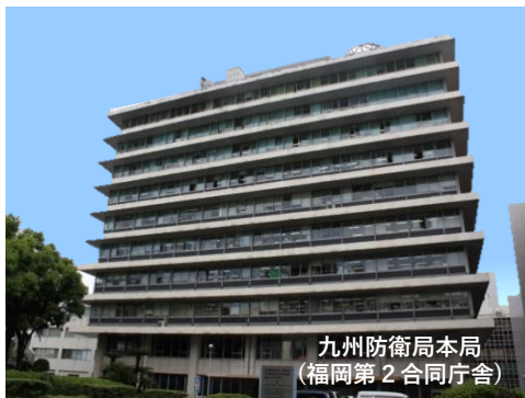
九州防衛局本局 （福岡第2合同庁舎）

九州防衛局総務部総務課 福岡県福岡市博多区博多駅東2-10-7福岡第2合同庁舎 TEL：092-483-8815