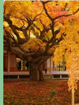
#雷山千如寺大悲王院