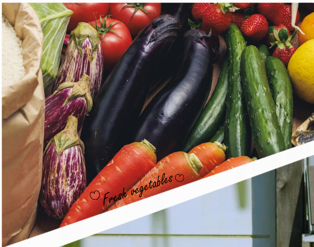
♡ Fresh vegetables ♡