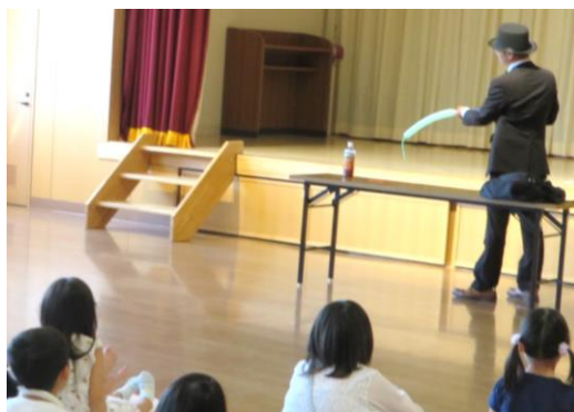
九州大学マジックサークル

例えば、九州大学マジックサークルは、コミュニティセンターなどで子ども向けイベントでマジックを披露し、大いに盛り上げています。また、九州大学鉄道研究同好会は鉄道模型の模擬運転会などを実施。子どもだけでなく、大人の集客にもつながっています。