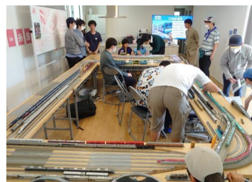
九州大学鉄道研究同好会