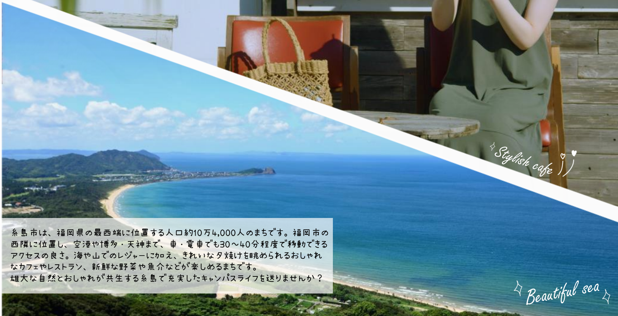
☆ Beautiful sea ☆

雄大な自然とおしゃれが共生する糸島で"充実したキャンパスライフを送りませんか？"