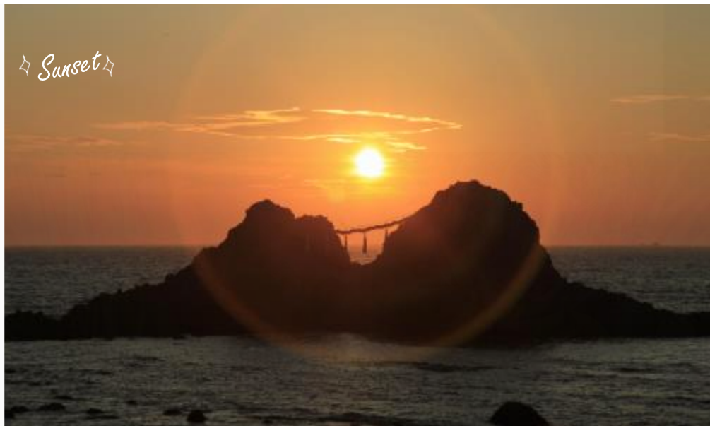
☆ Sunset ☆