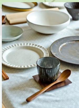
#いとしま応援プラザ