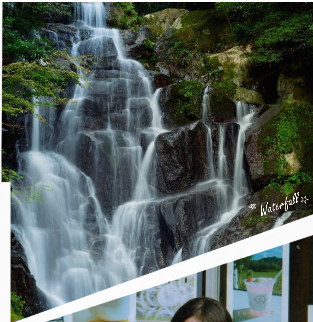
☆ Waterfall ☆