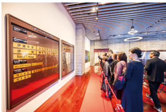
九州大学基金銘板@椎木講堂 2階