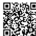
外国人留学生採用

https://www.kyushu-u.ac.jp/ja/education/employment/intl_recruit