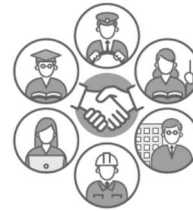
多様なステークホルダーとの協働