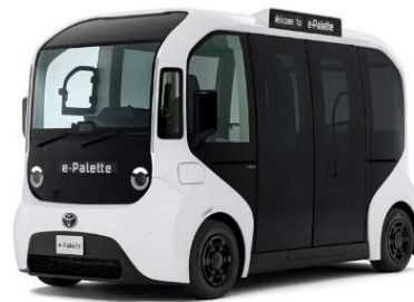
トヨタ自動車 WEB サイトより https://toyota.jp/e-palette/