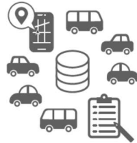
多角的なデータ分析