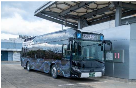
伊都キャンパス周辺で運行する大型水素燃料電池バス