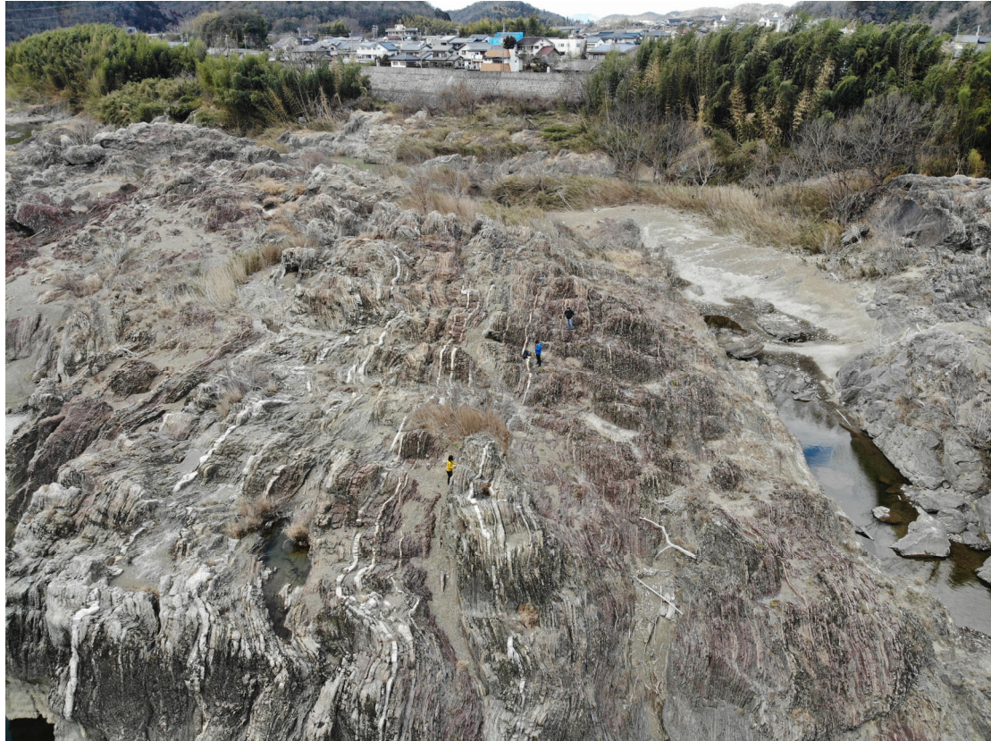
参考図 2. ヘリウム同位体分析を行った三畳紀層状チャートの露頭写真（岐阜県坂祝町取組）。