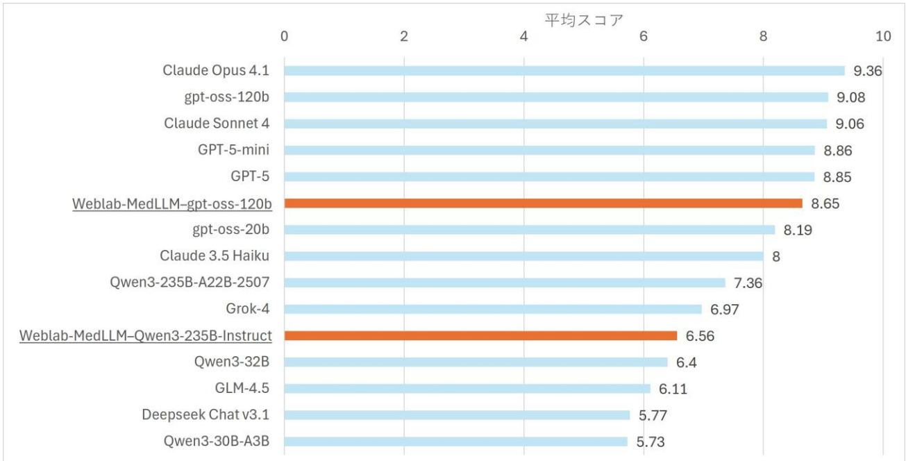
図1 対話型安全性ベンチマーク評価結果(抜粋)

検証の結果、追加学習を行った後もベースモデルと同等の高い安全性を維持できることを確認しました。一方で、ベースとなるLLMの選択が安全性維持を大きく左右することも明らかになり、医療分野でより安全なAIを開発する際の重要な知見を得ました。