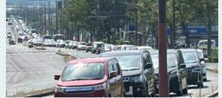
昨年度の混雑状況